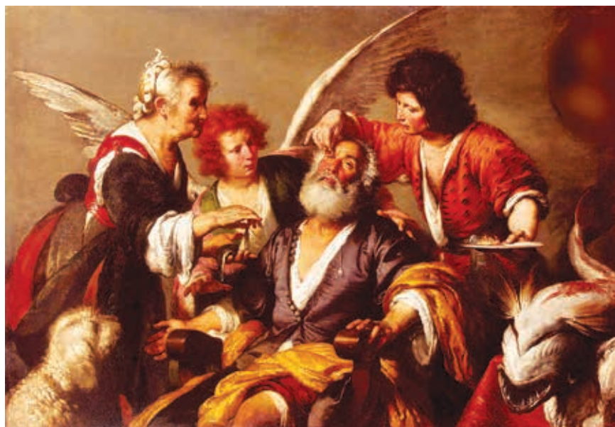
Slika 1. Tobije liječi oči svog slijepog oca Tobita ribljom žuči.

Životinjska mast (od sisavaca, riba i ptica; Adeps animalis L.) i bjelanjak djeluju protektivno na oštećeni epitel. Bjelanjak sadrži lizozim, ali je, nažalost, i idealno hranilište za bakterije (Brenko, Dugac i Randić, 2001, str. 80; Anonimo, 1905; Medić, 1909, str. 204, 208).